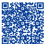
Consultation en allaitement