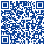
Conservation du lait maternel

Alimentation: ayez une alimentation équilibrée et variée tout au long de votre allaitement, mais évitez les régimes. Buvez suffisamment (2 litres par jour) mais évitez de consommer trop de thé ou de café. Un verre d'alcool de temps en temps n'est pas contre-indiqué, mais toujours après l'allaitement.